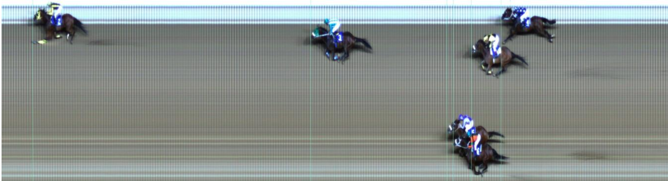
ΕΛΕΓΚΑΝΤΛΥ ΜΠΑΟΥΝΤ (IRE) | Choisir (AUS) - Boundless Joy (AUS) | ΝΙΚΗΣ: 5

Οι Ελλανοδίκες αφού εξέτασαν τις προηγούμενες συμμετοχές του ίππου και συγκεκριμένα συνέκριναν με την τελευταία που είχε διαγωνιστεί με 3,5 κιλά περισσότερα, κρίνουν ότι ο ίππος δεν διαγωνίστηκε σύμφωνα με τις δυνατότητες του και επιβάλλουν πρόστιμο διακόσια πενήντα (250) ευρώ στον προπονητή.