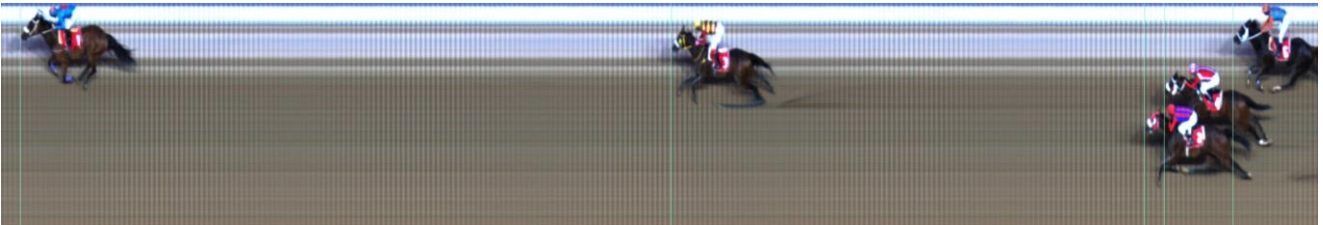
ΓΟΥΪΝΤΕΡ ΡΟΥΟΥΖ (IRE) | Dark Angel (IRE) - Rose Of Battle (GB) | ΝΙΚΗΣ: 4 ΙΔΙΟΚΤΗΤΗΣ: ΣΤΑΥΛΟΙ ΙΡΡΟΤΡΟΥΣΤ | ΠΡΟΠΟΝΗΤΗΣ: Μαυρόπουλος Σπ.

- Βγαίνοντας από το μηχανήμα εκκίνησης οι ίπποι ΜΙΣ ΣΑΠΦ και ΜΑΤΙΑΝΤΑΣ ΛΟ, παρά τις προσπάθειες των αναβατών τους κινήθηκαν προς την εξωτερική με τον τελευταίο ίππο να έρχεται σε επαφή με τον εξωτερικά του αναπτυσσόμενο ίππο ΤΗ ΑΤ ΔΕ ΡΙΤΖ ο οποίος δυσχεράνηκε στιγμιαία.