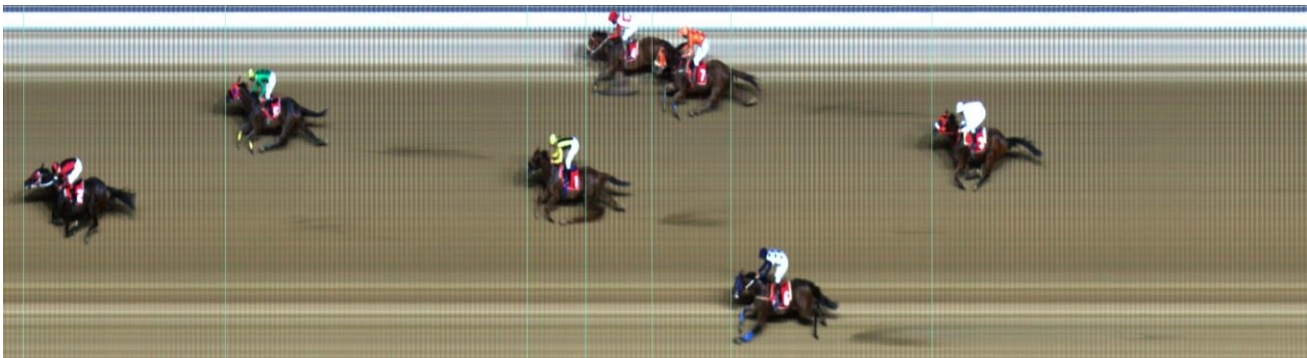
ΠΑΡΤΙΣΙΠΕΪΤ (GB) | Bated Breath (GB) - Imroz (USA) | ΝΙΚΗΣ: 3 ΙΔΙΟΚΤΗΤΗΣ: Ι.Ο.ΒΟ.Π. ΣΥΝΔΙΚΑΤΕ | ΠΡΟΠΟΝΗΤΗΣ: Χαραλάμπους Χ.

- Μεταζυγίσθηκαν όλοι οι αναβάτες των σημερινών υποδρομιών.