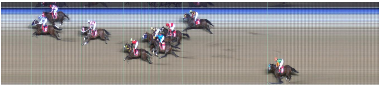
ΓΟΥΟΡΜ ΓΟΥΟΡΝΤΣ (GB) | Poet's Voice (GB) - Limber Up (IRE) | ΝΙΚΗΣ: 5 ΙΔΙΟΚΤΗΤΗΣ: ΚΗΟΥΡΙ SAMER | ΠΡΟΠΟΝΗΤΗΣ: Θεοδωράκης Χρ.

- Για διαδικαστικούς λόγους λήφθησαν ούρα από τον ίππο ΛΑΪΤΝΙΝΓΚ ΣΤΟΡΜ.